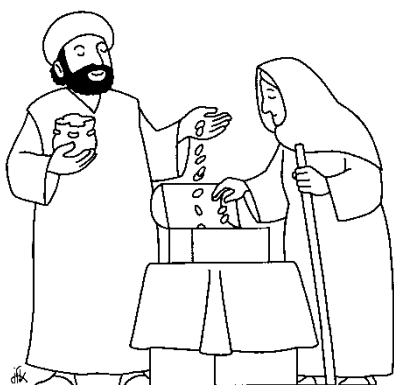
Jésus regardait les gens déposer leur offrande... Marc 12, 41

Peuple de frères, peuple du partage, Porte l'Évangile et la paix de Dieu.