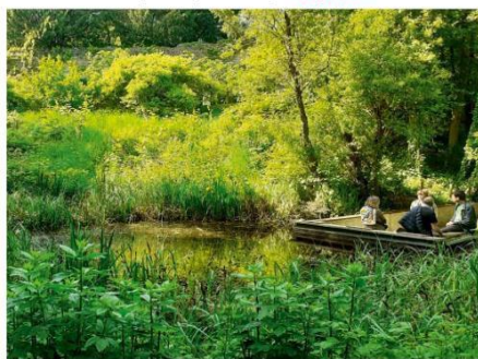
Repas au jardin naturel Pierre-Emmanuel rue de la Réunion

Des chiffres et des lettres pour comprendre les enjeux > Pages 7 à 10